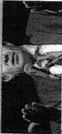
FERNANDO HADDAD ficará mal perante o mercado ou o PT?